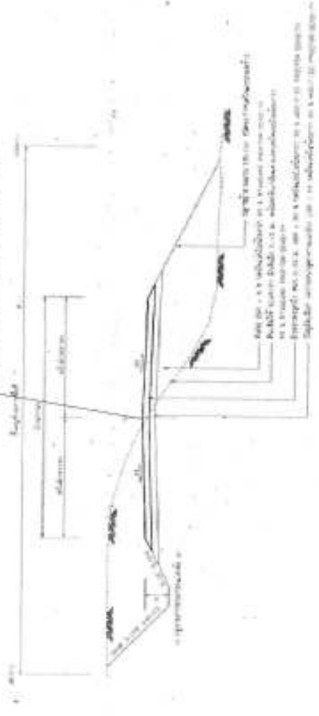
รูปที่ ๑๑ - ๑ - ๒ : ทัศนียภาพบริเวณก่อสร้าง