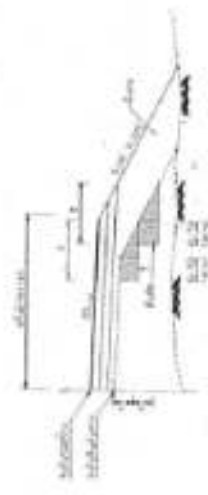
รูปที่ ๑๑ - ๑ - ๓ : ทัศนียภาพบริเวณก่อสร้าง